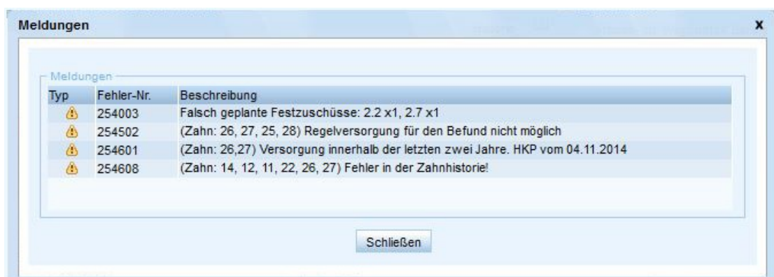
▲ Anzeige der Meldungen in atacama | ZE